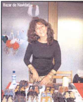
Bazar de Navidad