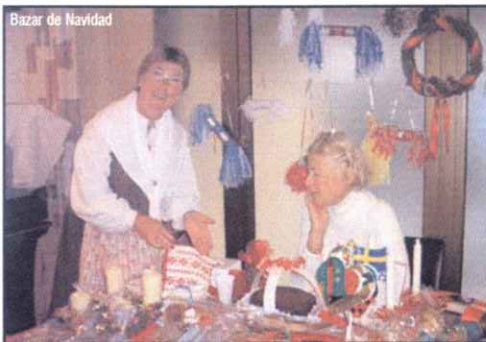
Bazar de Navidad