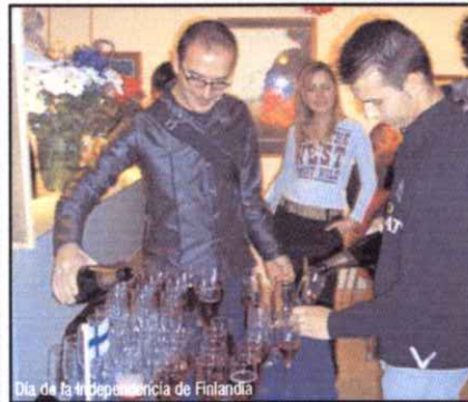
Día de la Independencia de Finlandia