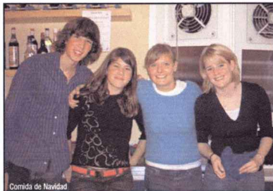
Comida de Navidad