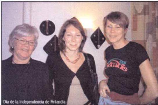
Día de la Independencia de Finlandia