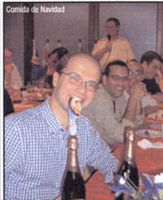
Comida de Navidad