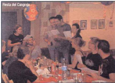
Fiesta del Cangrejo