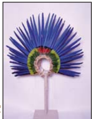
Diadema vertical. Grupo étnico zapoteco. Brasil, MNU.

En esta exposición mostramos al público la importante labor de los conservadores-restauradores a la hora de preservar estas las magníficas piezas de arte plumario del Museo y, sobre todo, queremos transmitir un mensaje que consideramos fundamental: lo que hoy conservamos será el legado cultural de las futuras generaciones, por lo que no podemos descuidarnos ni un segundo en nuestra tarea.