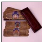
Libro de oración del budismo. Tibet. MNA.

Hemos leído ya muchísimos cuentos, hemos pasado ya muchas páginas. Sabemos muy bien cómo funciona un libro. Lo que hay dentro de él nos cuenta muchas cosas, pero su forma también.